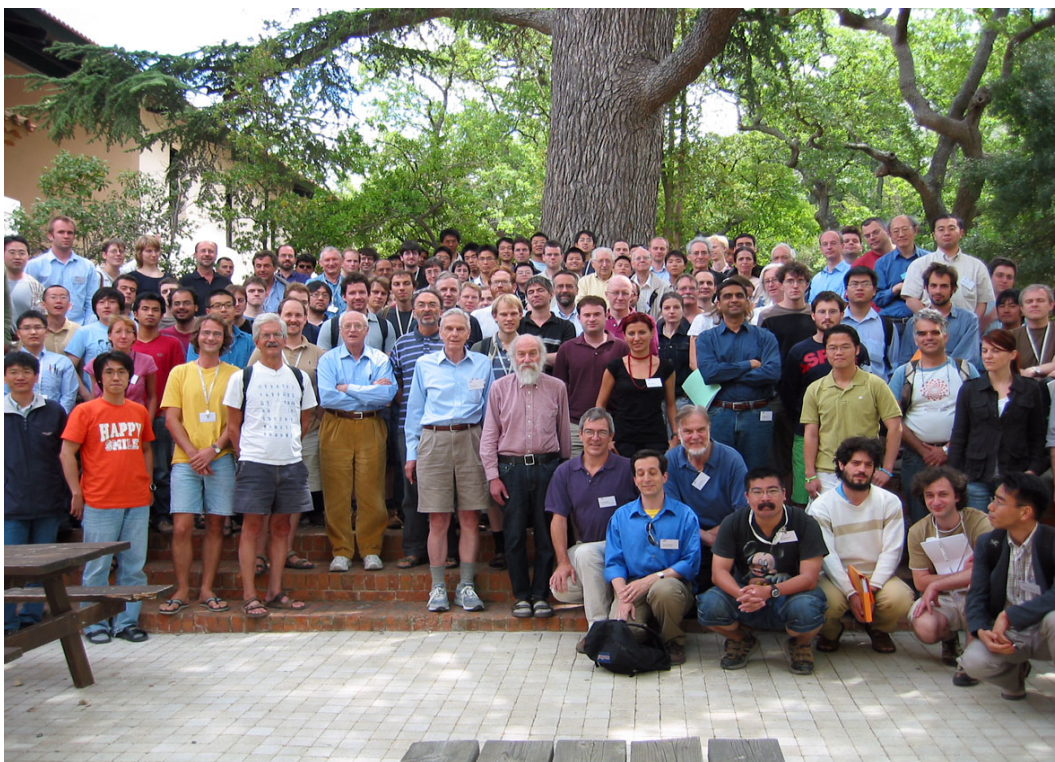
Рис. 1: Летняя школа “Гипотезы Серра о модулярности” в Марселе-Люмини, июль 2007